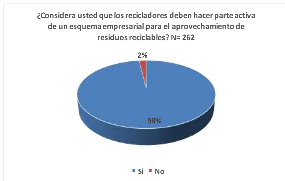
Gráfica 1. Porcentaje de aceptación de que los recicladores hagan parte de un esquema empresarial